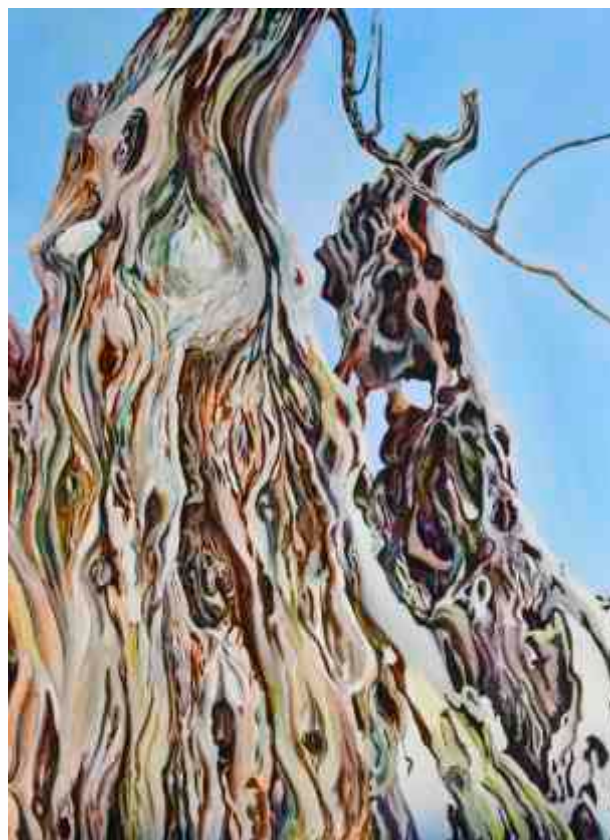
Maslina akrilik na platnu, 114 x 84 cm, 2000.