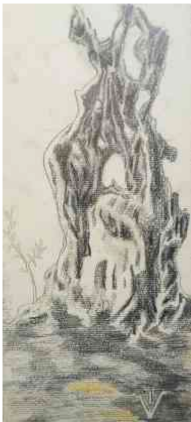
Maslina olovka u boji, 25 x 11 cm, 2019.