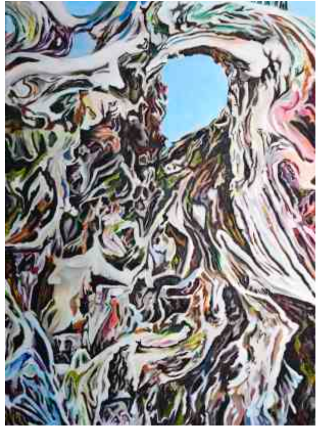
Maslina akrilik na platnu, 114 x 84 cm, 2014.