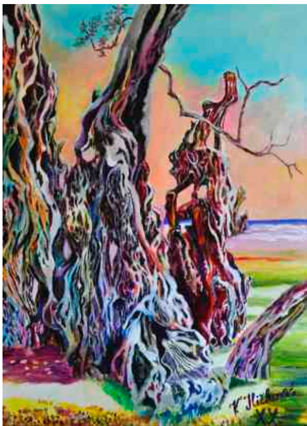
Maslina akrilik na platnu, 70 x 50 cm, 2000.