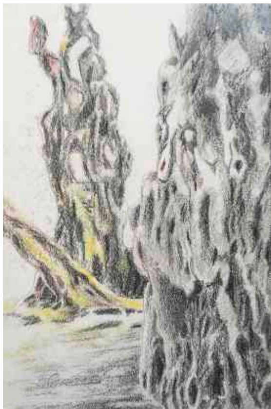
Maslina olovka u boji, 25 x 16,5 cm, 2019.