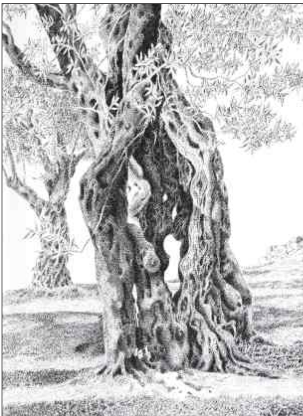
Maslina tuš, pero, 32 x 24 cm, 2012.