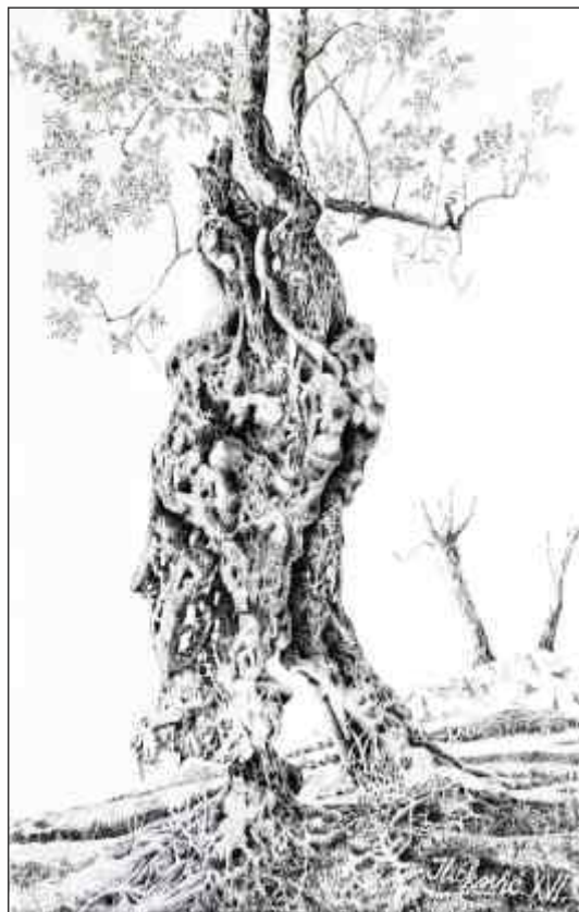
Maslina tuš, pero, 50 x 35 cm, 2016.