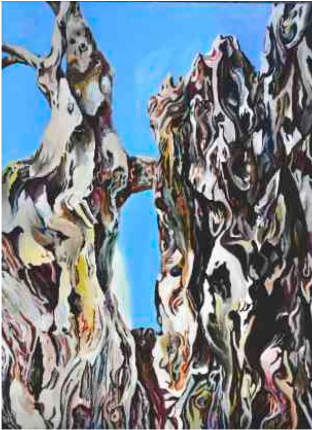
Maslina akrilik na platnu, 114 x 84 cm, 2014.