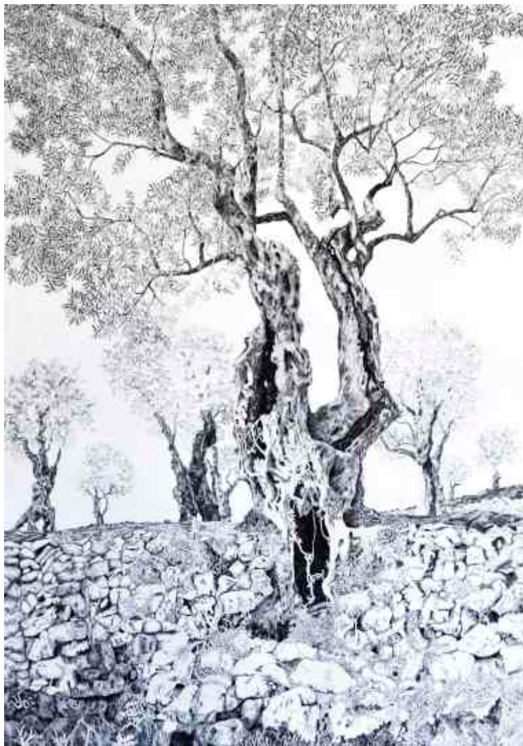
Maslina – tuš, pero, 60 x 80 cm, 2002.